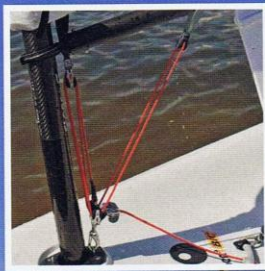
“De Bic is doordacht, zie bijvoorbeeld deze eenlijns- neerhouder en halstatie.”